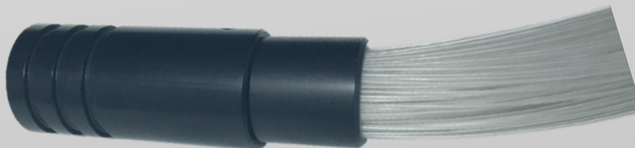
FASCIO A FIBRE OTTICHE

INSERIRE IL CONNETTORE COMUNE NELL'ILLUMINATORE E BLOCCARLO TRAMITE LA VITE PREDISPOSTA SOPRA L'ILLUMINATORE