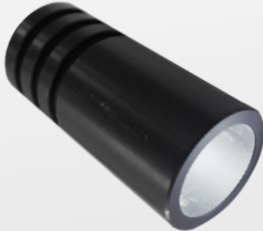
GÉNÉRATEUR LED LWH-LED3