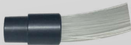
CONNETTORE COMUNE FASCIO A FIBRE OTTICHE