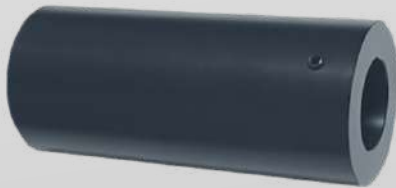
ILLUMINATORE LED RGB 9W