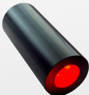
ILLUMINATORE RGB 9W