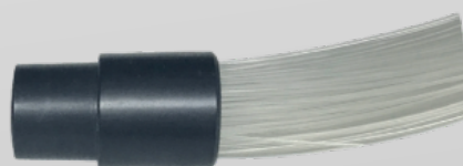
CONNETTORE COMUNE FASCIO A FIBRE OTTICHE