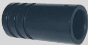
GÉNÉRATEUR LED RGB+W 3W